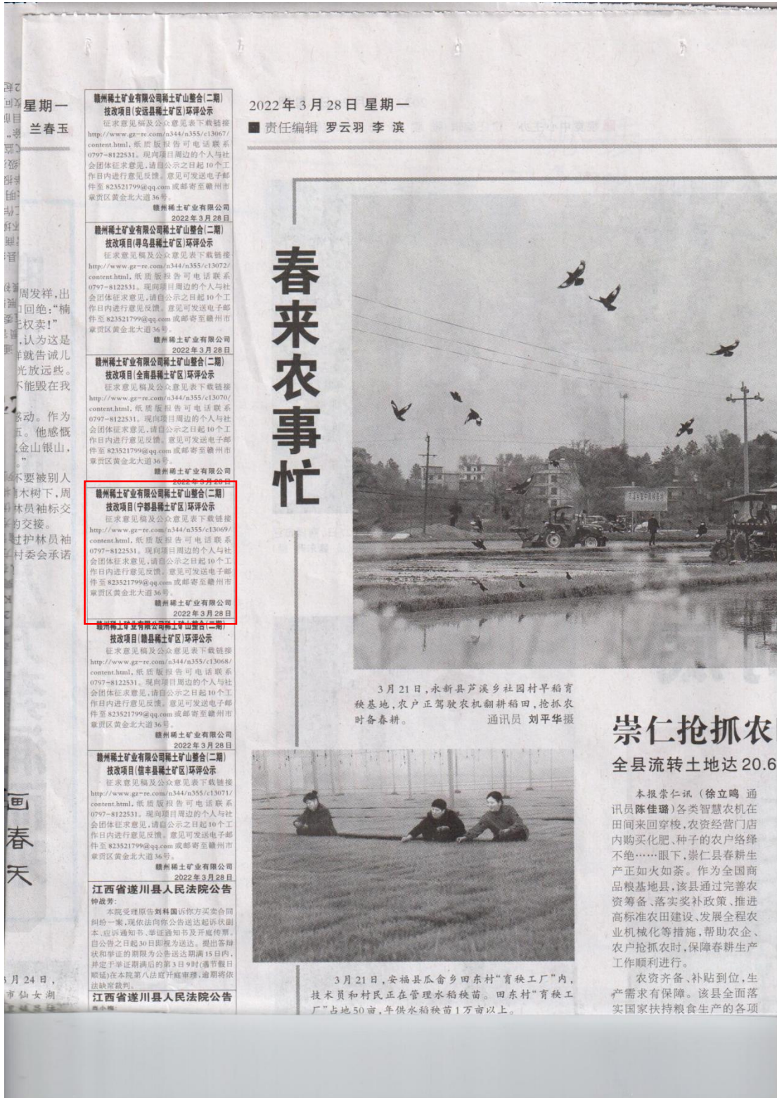
图4 第二次公众参与报纸公示（江西日报第二次公示）