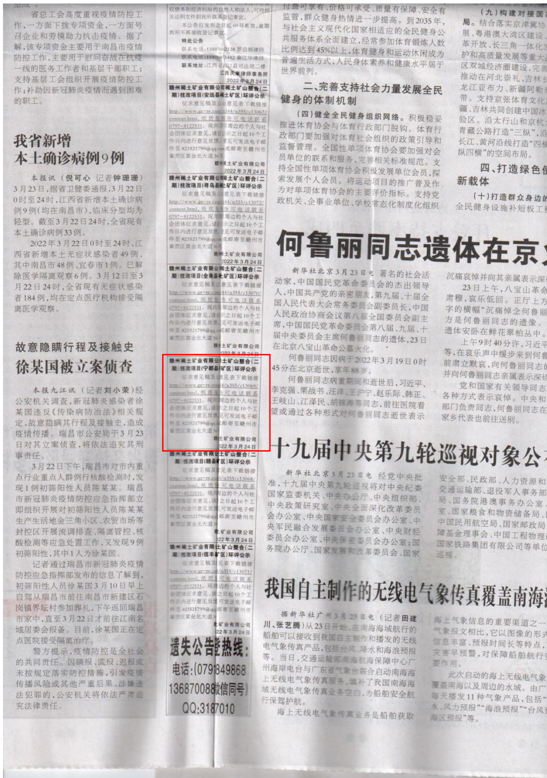
图3 第二次公众参与报纸公示（江西日报第一次公示）